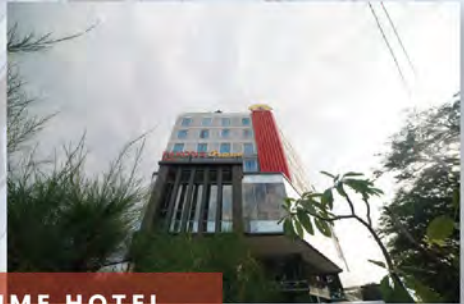
PAKONS PRIME HOTEL