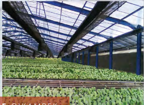
GREEN HOUSE CIKAMPEK