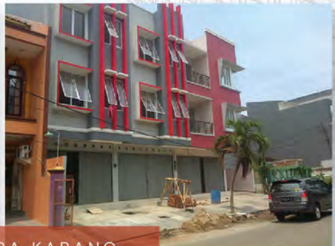
RUKO MUARA KARANG