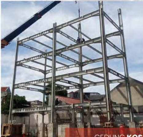
GEDUNG KOS MERUYA